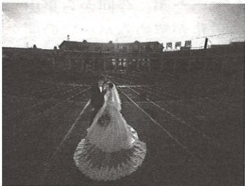
杉車庫前でも可能