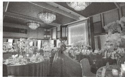
▲日輪の新しいコーディネートを提案

【日輪】では新コーディネートを提案。格調高いホテルウエディングを希望する顧客には白を基調とした『THE IMPERIAL』、ナチュラルテイストを好むカップルにはグリーンを装飾に取り入れた『THE FOREST』の2種類を用意している。