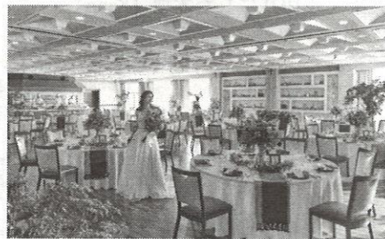
▲ダイニングの太陽をリニューアル

限定特典の内訳は、ドレス1点のプレゼント、チャペルまたは神殿の挙式が無料になる。また、ドリンクコースのランクアップなど8種類の特典も用意。さらにトータルの