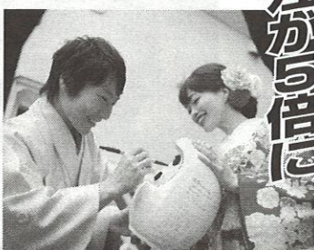
▲人気の演出はパートナー企業からの企画

「人気のプランとなっている松本だるまへの目入れのアイデアはパートナー企業発の企画です。お互いに一緒に挙式をつくるという意識のもと、コミュニケーションによって良い関係性も築けます。」（船坂氏）